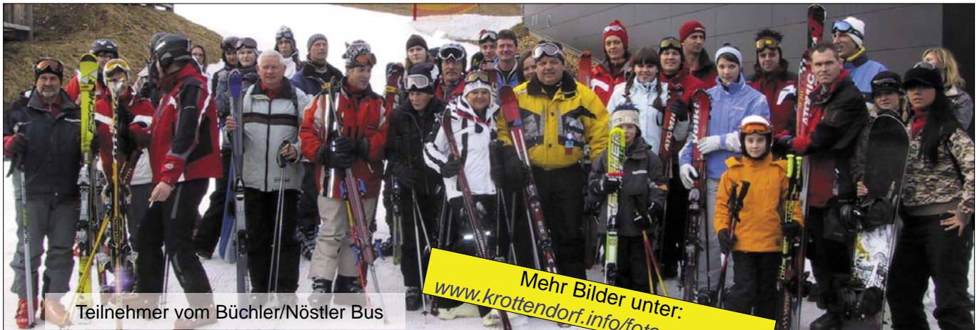
Teilnehmer vom Büchler/Nöstler Bus

Mehr Bilder unter: www.krottendorf.info/fotogalerie.htm