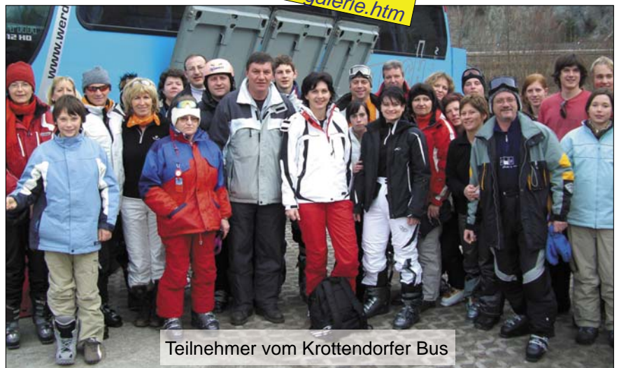
Teilnehmer vom Krottendorfer Bus

Trotz des milden Winters und teilweisen Schneemangels in den Schigebieten herrschte wieder großes Interesse für den diesjährigen Gemeindefest am 24. Februar 2007, der uns auf die Reiteralm führte. Die Reiteralm ist für die sichere Schneelage, ihre gut präparierten Pisten und Abfahrten bekannt. Sicherlich auch ein Grund dafür, dass diesmal wieder über 260 BürgerInnen aus Krottendorf und Thannhausen daran teilnahmen.