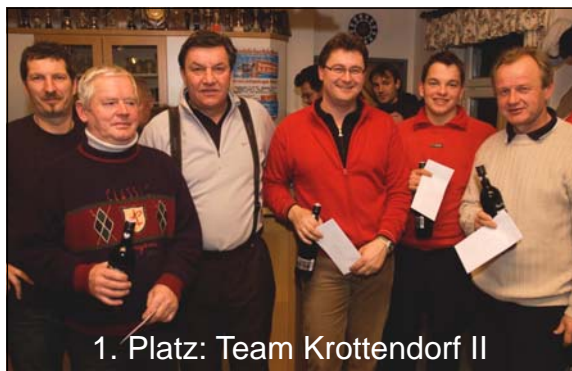
1. Platz: Team Krottendorf II

Bei optimalen äußeren Bedingungen wurde am 22. Jänner 2010 der Gemeindevorstand 2010 auf der Teichanlage des ESV Krottendorf gekürt. Kurzfristig vom Team des Gemeindeamtes organisiert nahmen 11 Mannschaften an diesem Turnier teil. Für den Turnierablauf und für die Verpflegung während und nach dem Schießen zeigte der ESV Krottendorf verantwortlich. Nach spannenden Spielen, wobei aber auch der Spaß nicht zu kurz kam, konnten sich schließlich die Hausherren aus Krottendorf durchsetzen.