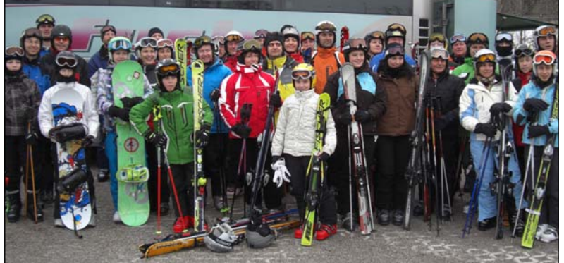
Teilnehmer vom Bus aus Krottendorf