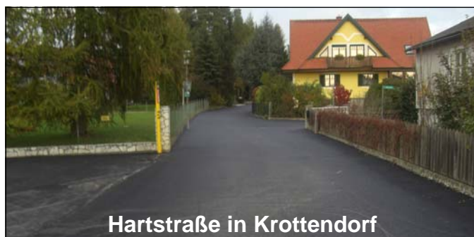
Hartstraße in Krottendorf

In allen Fällen bedanken wir uns bei den Anrainern für das aufgebrachte Verständnis.