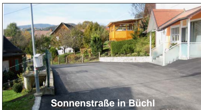
Sonnenstraße in Büchl

Die Asphaltierungsarbeiten der Hartstraße und des Mitterweges in Krottendorf konnten am 30. Oktober 2009 abgeschlossen werden.