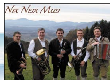
NIX NEIX MUSI