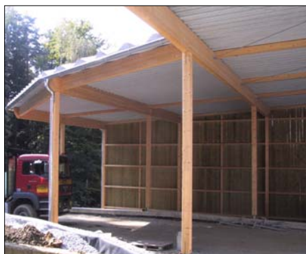
Neue überdachte Fläche im ASZ

Am Samstag , dem 7. Oktober 2006 veranstaltet die Gemeinde Krottendorf in Kooperation mit dem Abfallwirtschaftsverband einen „Partnertag der Abfallwirtschaft“ mit einem „Tag der offenen Tür“. Unser Altstoffsammelzentrum in Büchl kann am Samstag , dem 7. Oktober 2006 in der Zeit von 08.30 bis 12.00 Uhr besichtigt werden. Herr Willibald Heuegger hat sich bereit erklärt, für Fragen betreffend Mülltrennung und alles was dazugehört zur Verfügung zu stehen. Auch ein mit Biodiesel betriebenes Fahrzeug wird zu sehen sein. Unsere Gemeindearbeiter werden Sie nebenbei mit kleinen Imbissen verköstigen. Nützen Sie die Gelegenheit und kommen Sie vorbei.